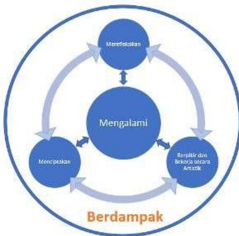
Gambar 1. Lima elemen/domain landasan pembelajaran seni rupa