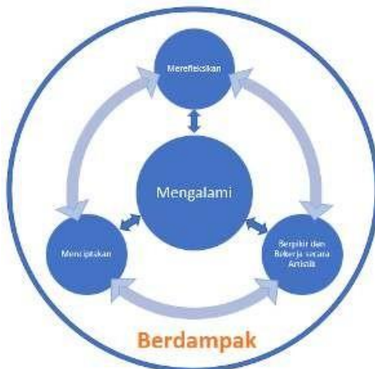
Gambar 1. Skema Elemen Capaian Pembelajaran Seni

Pada praktik pengajarannya, Seni Teater menggunakan sejumlah elemen pendekatan sebagai berikut.