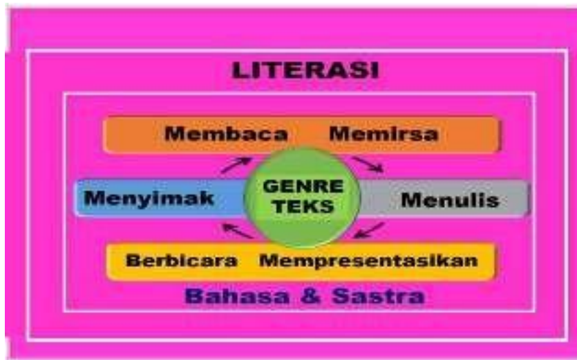
Gambar 1: Rasional Pembelajaran Bahasa Indonesia

genre, pembelajaran bahasa Indonesia dapat dikembangkan dengan model-model lain sesuai dengan pencapaian pembelajaran tertentu. Pembinaan dan pengembangan kemampuan berbahasa Indonesia akan membentuk pribadi Pancasila yang beriman, bertakwa kepada Tuhan yang Maha Esa dan berakhlak mulia, berpikir kritis, mandiri, kreatif, bergotong royong, dan berkebinekaan global. Rasional sebagaimana diuraikan di atas dapat dipaparkan pada gambar 1 sebagai berikut.