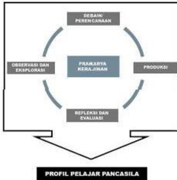
Bagan Pembelajaran Prakarya Kerajinan

Elemen pada mata pelajaran Prakarya Kerajinan saling berkaitan dapat digambarkan sebagai berikut: